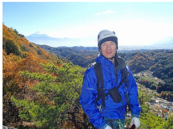
左岩稜頂上 富士山をバックに

もう少しクライミングが続くかと思いきや、祠が見えて半分は登山道。祠の前でビレイする。