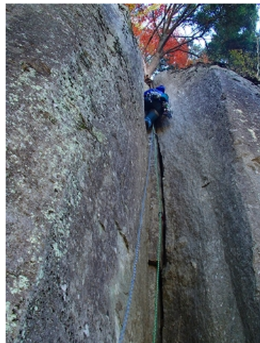
2P目のダブルクラック