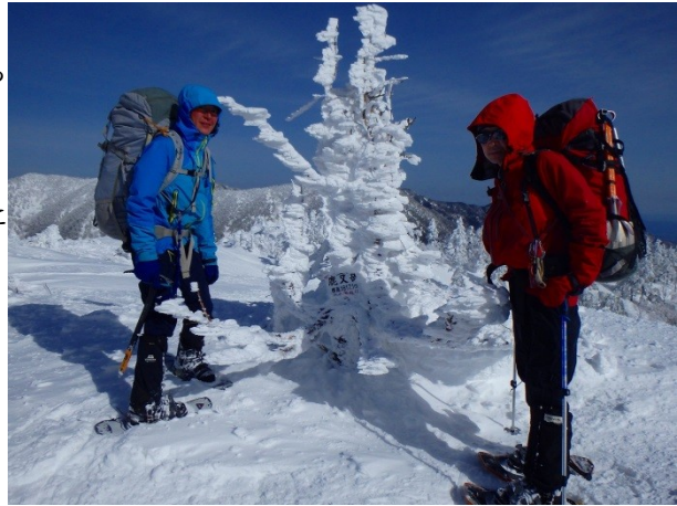
小さな「モンスター」の前で

鹿又岳の少し先の下りは少し急な部分がある上、ウインドクラストしていて嫌らしい。しかしピッケルを取り出すとスノーシューでもバックステップなら不安を感じることはなかったので私はそのまま下りたが、他の二人は万全を期してアイゼンに付け替えた。下り切ったところを見届けると、アイゼンのままこちらに進んで来ると、私も先を急ぐことにする。