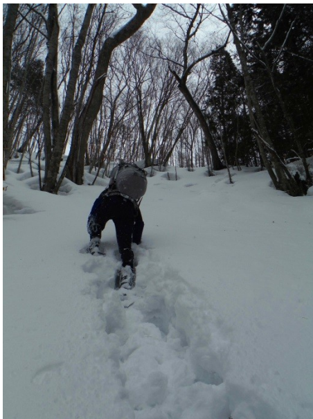
急な尾根に取り付く

尾ヶ倉沢右岸尾根は藪っぽく、なるべく灌木を避けるようなルートを取りながら鹿又山を目指す。しかし間もなくそれらはすっかり雪に覆われ、すっきりする。ルーファイの楽しみは減ったが、快適に登る楽しみを得る。その後急な登りを何回か強いられたが頑張って登り、男鹿岳から南に延びる稜線へと出る。そこには避難小屋とは違う、工事現場等で使用される移動式のユニットハウスが置かれていた。そこから鹿又岳まではもう一登り。登り切った所には小さな「モンスター」に同化した、山名表示板が付けられていた。風も強いので、その前で写真を撮って早々に瓢箪峠を目指すことにする。