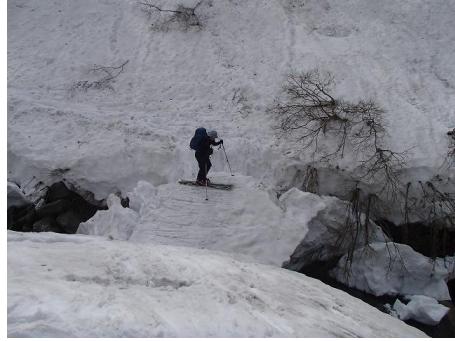
壊れかけのスノーブリッジ

仙ノ倉谷に近い下流部では猟友会の方たちにお会いした。熊を一頭仕留めたばかりのようだった。充実した山行と暖かい日差しは常に皆を笑顔にする。「いつも黒い服を着ている〇〇さんがいたら撃たれちゃうよね～」などと談笑しながら、除雪の進んだ毛渡沢沿いの林道をスキーを背負って歩いた。