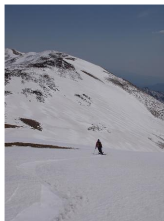
快適なシッケイ沢源頭

平標山からの眺めは最高で、かねてから滑ってみたいと思っていた沢の源頭が丸見えだ。ああ、あそこも行かなきゃ、ここも行かなきゃと気持ちが膨らむ。そしていつものように、いつまでも眺めていたいと思う気持ちと早く滑り出したいという気持ちがせめぎ合う中での滑降準備だ。